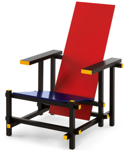
Gerrit Rietveld, Holanda, 1888 - 1964 “Silla roja y azul” Madera y pintura, 86 x 65 x 83 cm

Su obra “Composición en rojo, amarillo y azul” es una pintura compuesta solo por líneas y bloques de colores bien equilibrados. Con ellos logra crear un efecto armónico a pesar de la simplicidad de los medios que utiliza. Mondrian crea un universo en cada una de sus obras, cada uno de sus cuadros es un pequeña parte de un universo esencial y complejo que se ve limitado por el espacio acotado del soporte. Cada uno de sus rectángulos de colores se expande hasta el borde dando la idea de que no tienen fin y se prolongan más allá del marco, hacia el infinito.