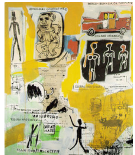
»» Jean-Michel Basquiat “Untitled”, 1984