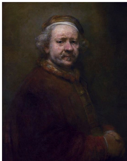
Rembrandt Autorretrato a la edad de 63 años 1669, Óleo sobre tela 26x30cm, National Gallery