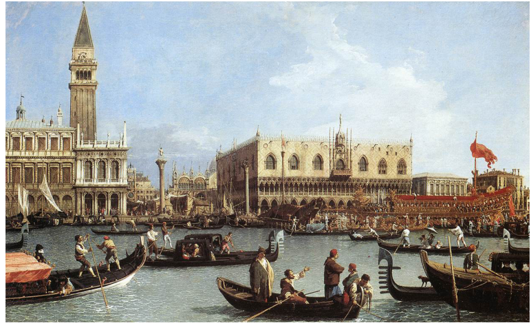
Canaletto, El Bacino di San Marco en el día de la Ascensión, c.1733-34, óleo sobre tela, 76,8x125,4 cm. Royal Collection, Londres.

Observamos el uso constructivo de la luz, en la obra del artista italiano Giovanni Antonio Canal (1697-1768) conocido también como Canaletto, quien fue un importante pintor, afamado por sus paisajes urbanos, particularmente de Venecia, popularizando allí el género de la veduta –o “vista” en italiano–. Este tipo de obra representa ciudades de manera panorámica y con un estilo cartográfico, donde el entorno es descrito de forma minuciosa, enfocándose princi-